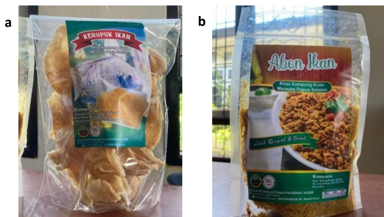
Gambar 3. Hasil olahan produk kelompok Noh Tabuk a) Kerupuk Ikan ; b) Abon Ikan

Pada awal berdiri pada bulan Juni Tahun 2021 kelompok ini masih dikategorikan belum berkembang dikarenakan belum adanya produk yang dihasilkan. Selanjutnya pada tahun 2022 kelompok Noh Tabuk sudah menunjukkan adanya peningkatan dibandingkan tahun sebelumnya. Adapun produk yang dihasilkan yaitu kerupuk ikan dan abon ikan. Saat ini produk hanya dipasarkan di wilayah sekitar Kampung Kuler dengan metode promosi ke teman di karenakan produk belum memiliki izin PIRT.