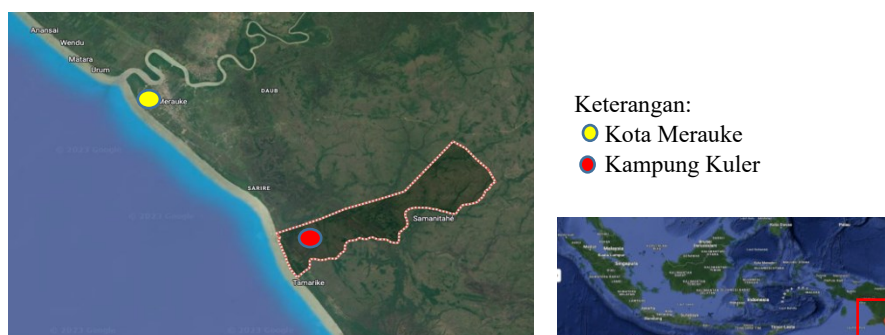
Gambar 1. Peta lokasi penelitian

Penelitian ini dilaksanakan pada bulan Maret sampai bulan April tahun 2023 bertempat di UMKM Kelompok Noh Tabuk di Kampung Kuler Taman Nasional Wasur Merauke, Kecamatan Naukenjerai Kabupaten Merauke Provinsi Papua Selatan.